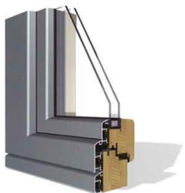
Classico (Linea leggermente squadrata)