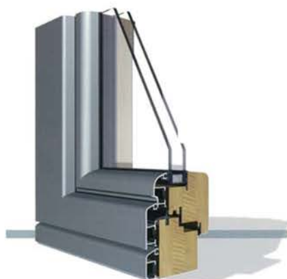
Classico Soft (Linea arrotondata)

Evita i disagi delle finestre in metallo (condensa, basso isolamento termico...)