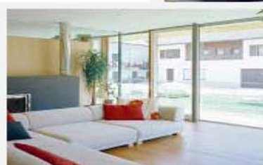
Maico HS Performance